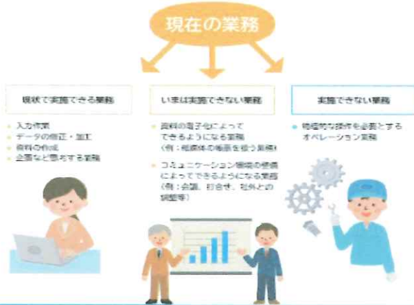
図表 E-4-1 仕事業務の整理